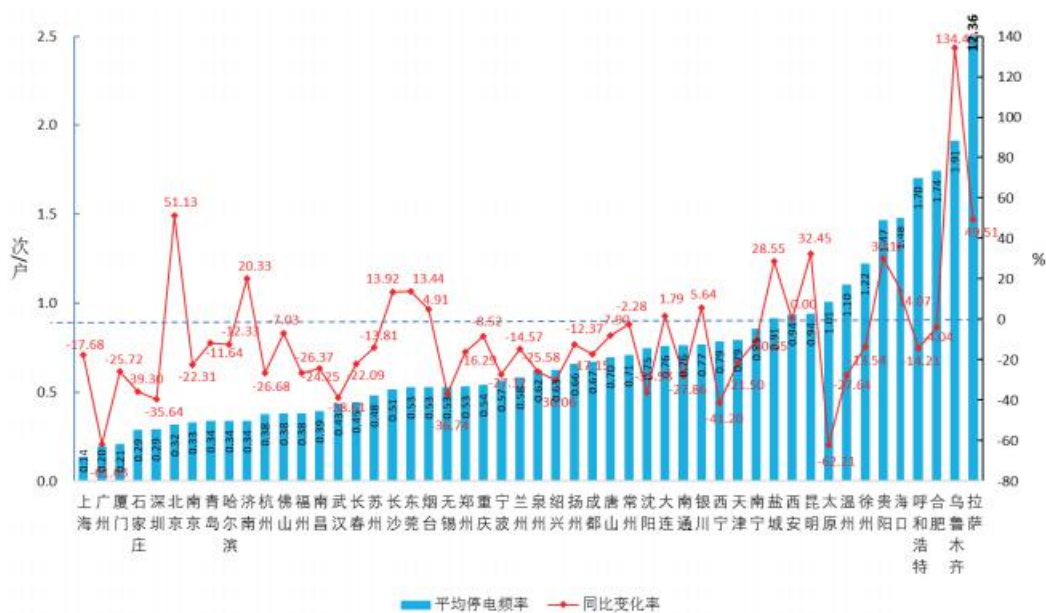
图 6-22 2019 年 50 个主要城市用户平均停电频率对比（城市地区）