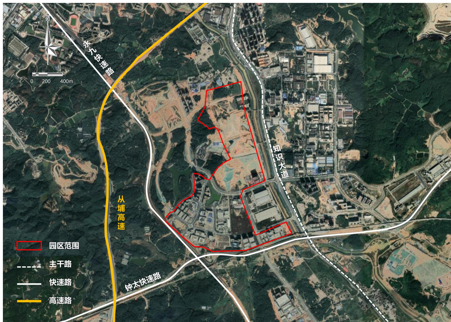
黄埔国际生物医药价值园区