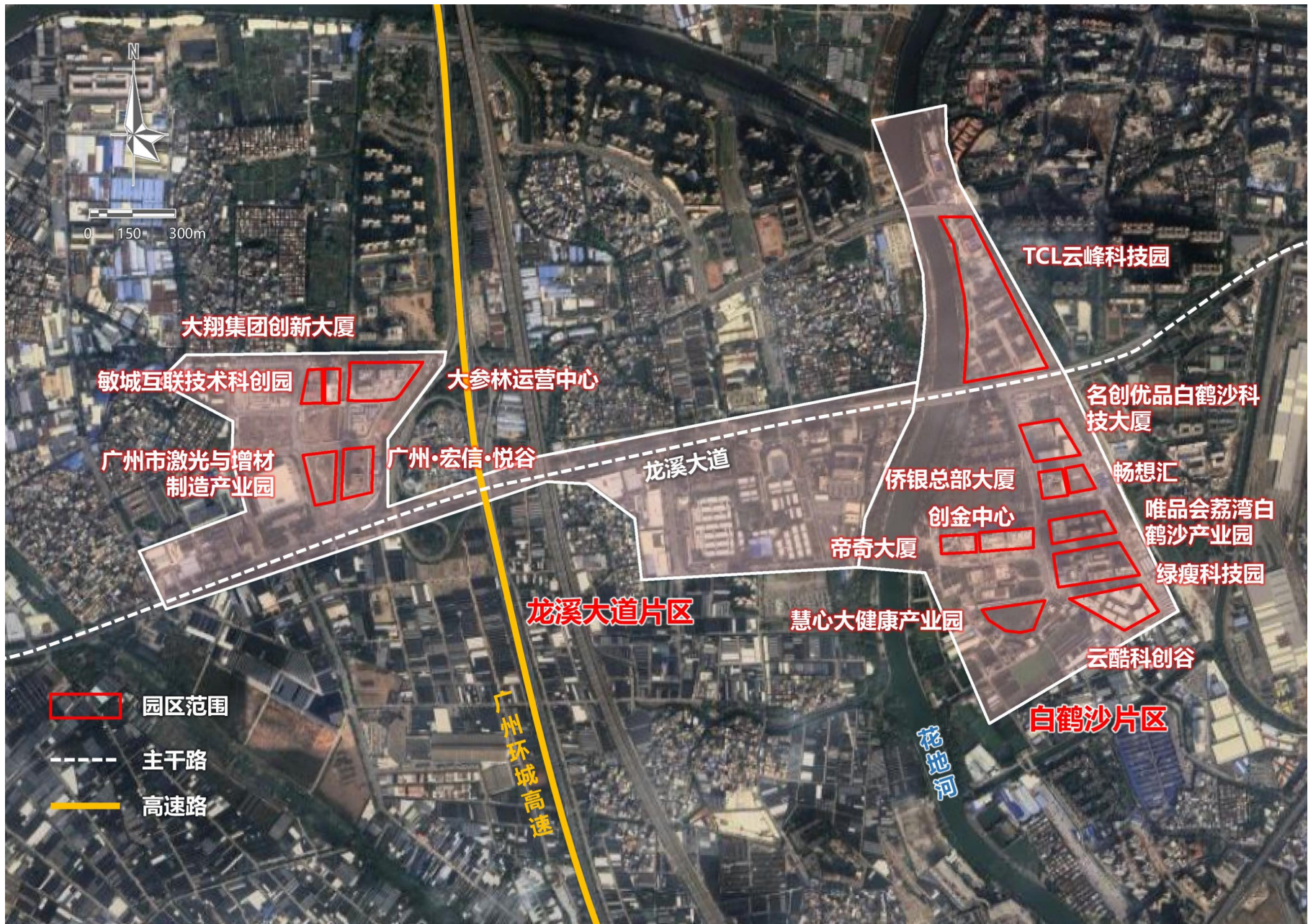
荔湾现代中药与高端医疗器械价值园区