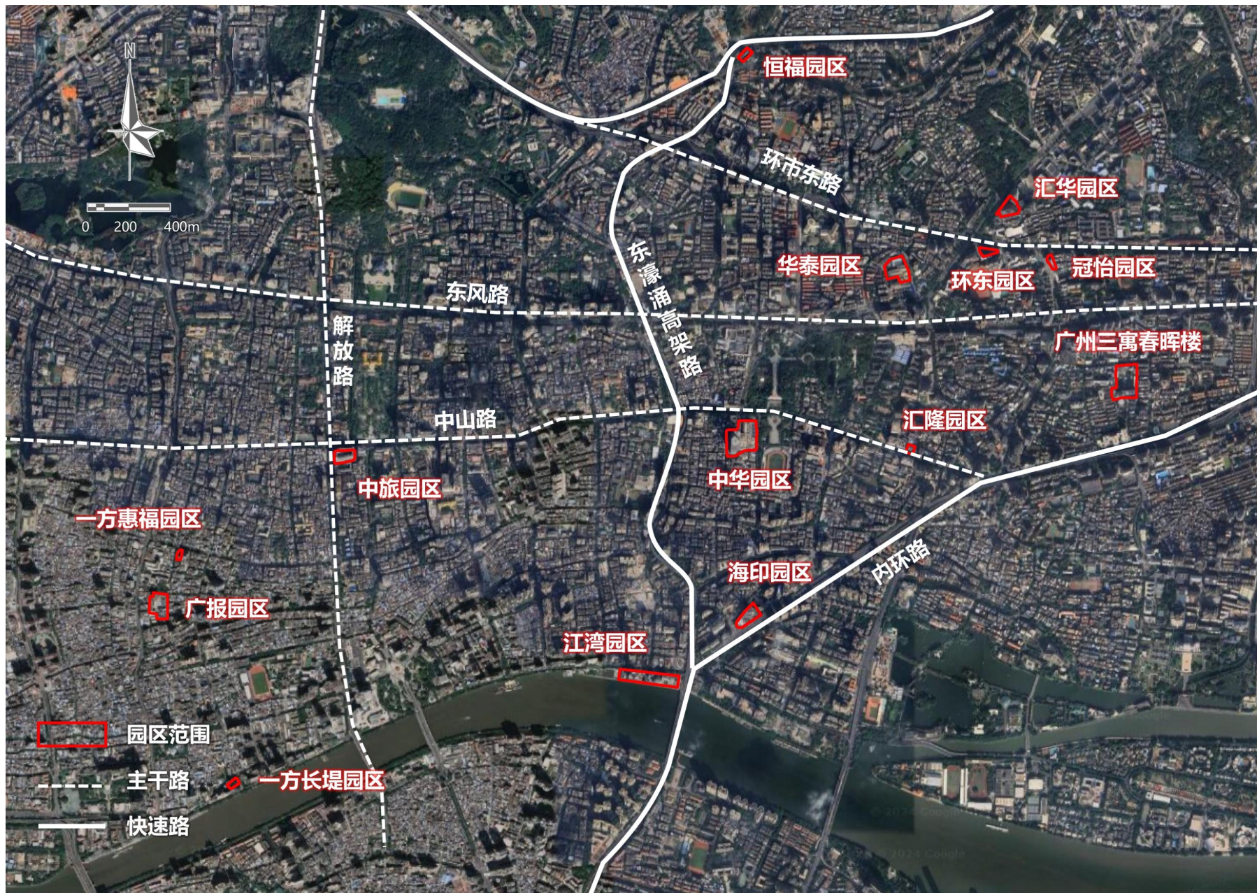
越秀临床技术成果转化价值园区